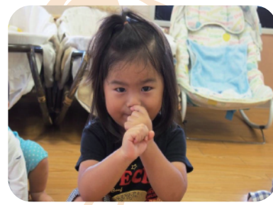
④トントントンてんぐさん♪