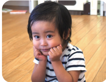
③トントントンこぶじいさん♪