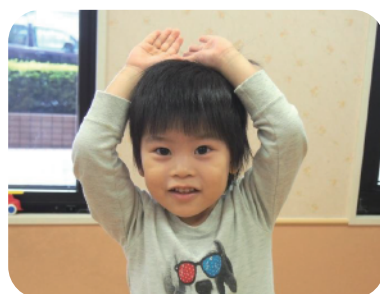
⑥トントントンうさぎさん♪