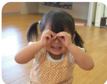
⑤トントントンめがねさん♪